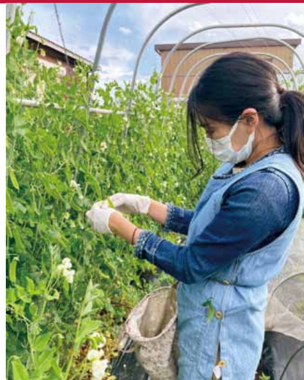
北須賀の美し農園(うましのうえん)で農業体験

A コロナ禍においては観光客や観光消費額が減少していることから、観光消費額の拡大に向けた取り組みは大変重要であると認識しています。また、成田国際空港株式会社や周辺自治体と協力し、国の実証事業として新たな観光コンテンツの造成などを行っております。その中で、新生成田市場の活用や農業体験、地域の食文化、観光需要の回復を見据えた観光資源の掘り起こしを行うなど、今年度中にモニターツアーを実施する予定です。今後も、農業体験などを含めた観光資源の高付加価値化や滞在時間の延長など、観光消費額の拡大につながるよう取り組んでまいります。